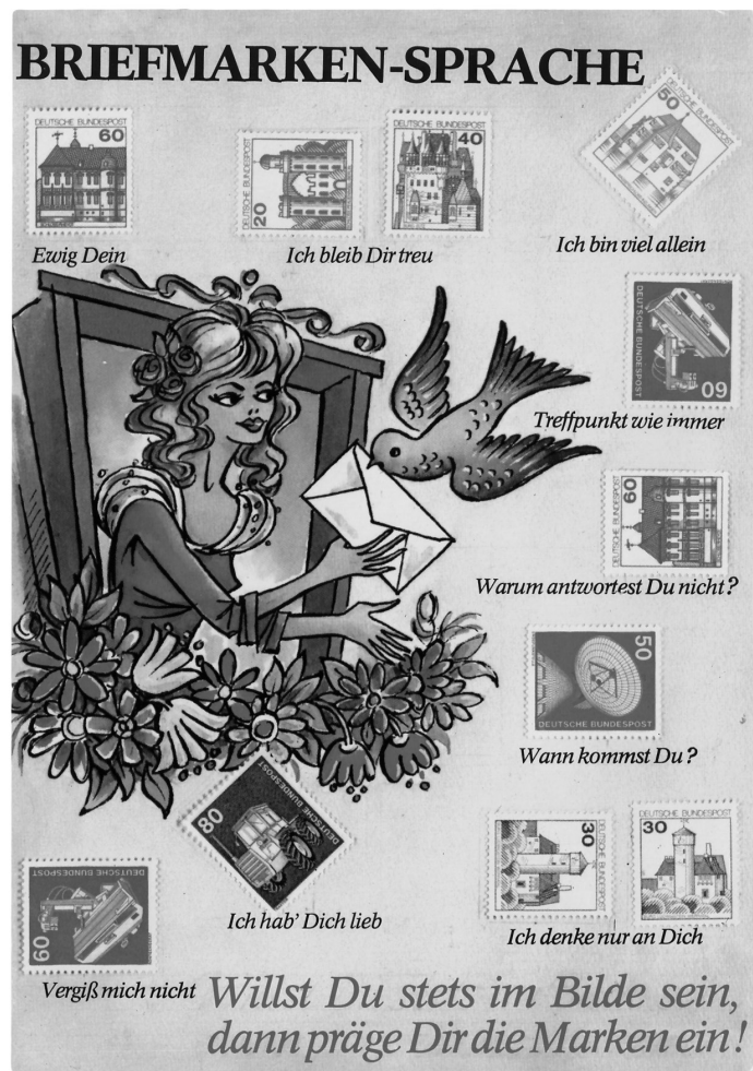
Abb. 3: Ansichtspostkarte, ungelassen, 1982; Museumsstiftung Post und Telekommunikation, Inventarnummer 3.2019.2125.