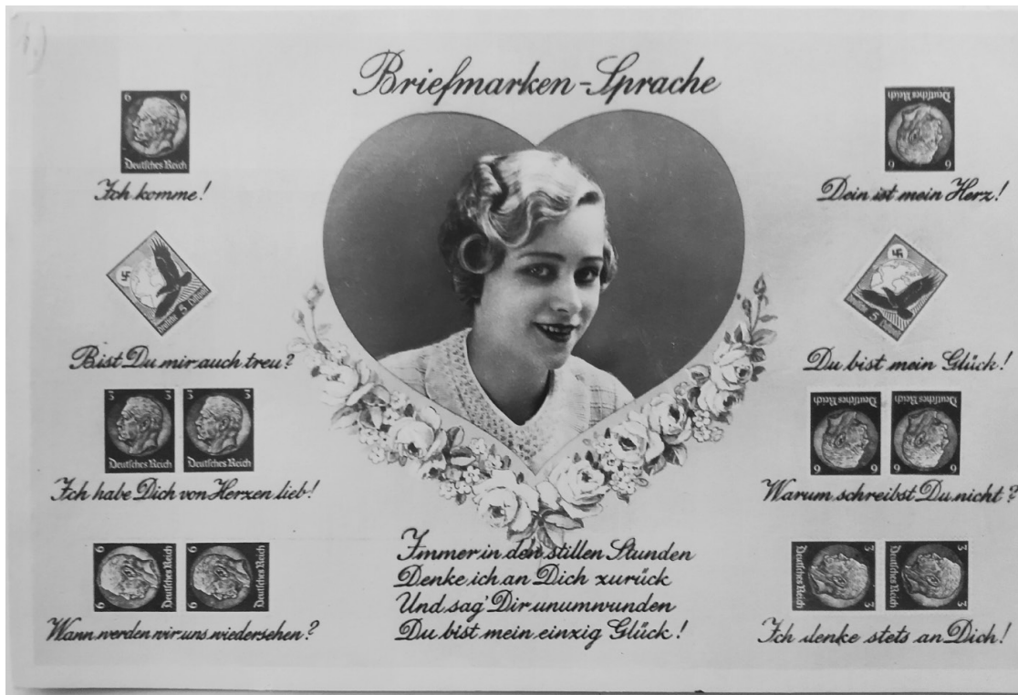
Abb. 2: Ansichtspostkarte, undatiert, ungelassen; Privatbesitz.