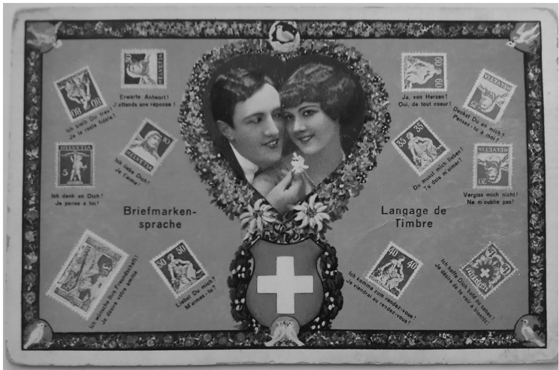
Abb. 1: Ansichtspostkarte, undatiert, ungelauften; Privatbesitz.

«Briefmarkensprache» und «Langage de Timbre» sieht man auf verschiedenste Art verdrehte Briefmarken, die mit Erläuterungen versehen sind: «Erwarte Antwort!» verlangt zum Beispiel eine um 90 Grad nach links gedrehte Marke, während eine spiegelbildlich gekippte ausruft: «Oui, de tout cœur!» 2 Ergänzend zum regulär geschriebenen Text eröffnet sich also eine zweite Mitteilungsebene, die lustvoll-spielerisch die Briefmarken sprechen lässt, wenn man sie nach den Vorgaben aufklebt.